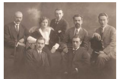
( http://irkipedia.ru/sites/default/files/illustr/02.jpg ) Дети Г.Я. Домбровского. Ок. 1917 г. Москва. Фотограф неизвестен. Из семейного архива Д.Ц. Портновой.